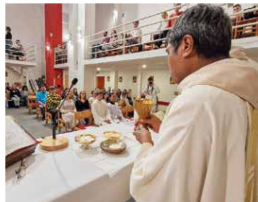
• P. Generálny Superior SVD počas sv. omše v Univerzitnom pastoračnom centre v Bratislave

to bola moja túžba prísť vás navštíviť na Slovensko. Ale kvôli zaneprázdneniu som to nemohol uskutočniť, až teraz. Konečne som tu na tejto slávnosti 100. výročia prítomnosti misionárov verbistov na Slovensku a v Česku. Som veľmi vďačný za to, že tu môžem byť. >>>